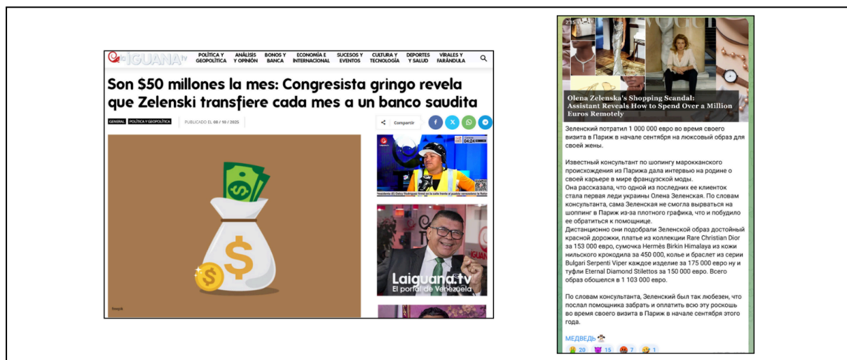
Ejemplos de publicaciones detectadas apoyando esta narrativa