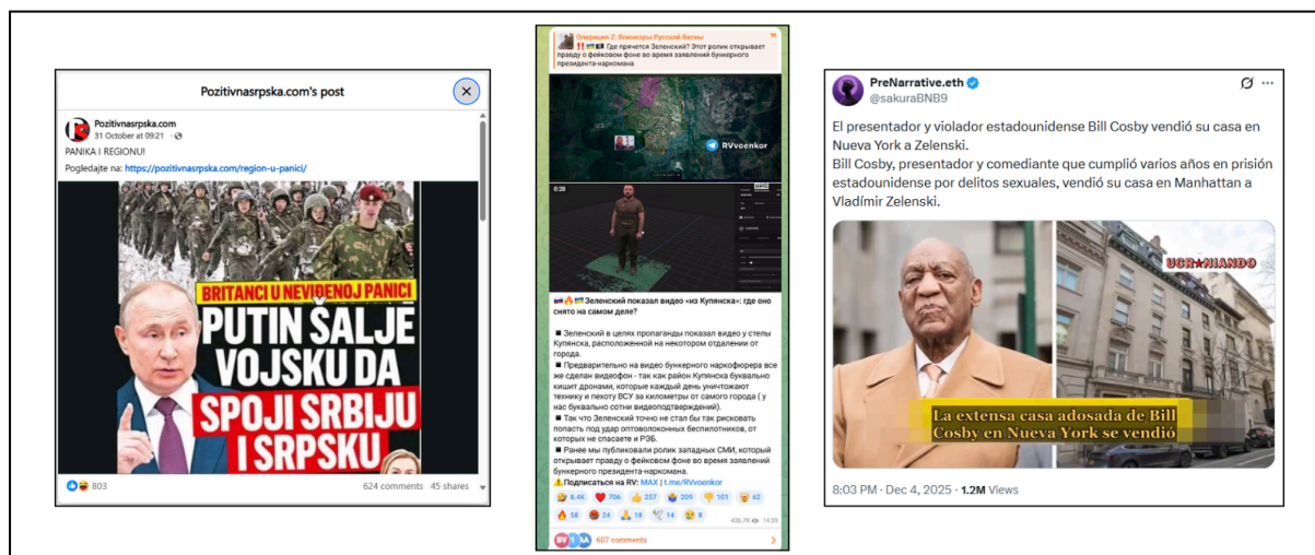
Ejemplos de publicaciones detectadas en la región

X alojó la mayoría de los posts virales de desinformación en el país, y solo uno de ellos fue etiquetado mediante una Nota de la Comunidad. Dos publicaciones que afirmaban falsamente que Zelenski había comprado la casa de Bill Cosby en Nueva York por 29 millones de dólares y ranchos valorados en 79 millones de dólares acumularon en conjunto 2 millones de visualizaciones en la plataforma. Se observó un nivel de alcance similar con un vídeo generado con IA y no etiquetado , que mostraba a un supuesto soldado brasileño llorando y expresando arrepentimiento por haberse alistado en el ejército ucraniano.