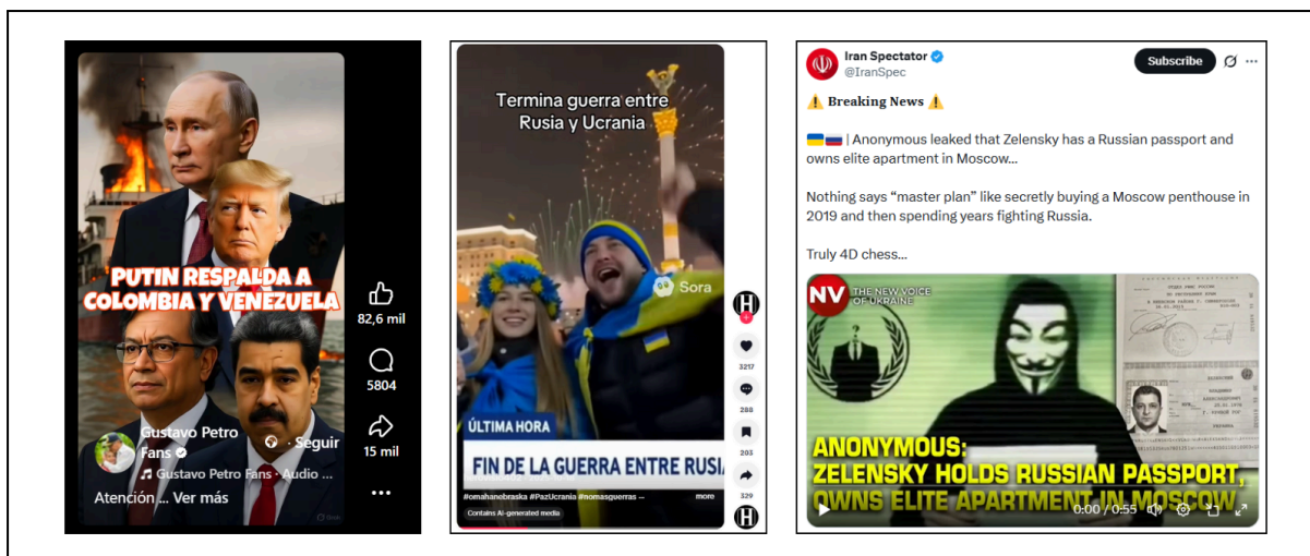
Ejemplos de publicaciones detectadas en la región